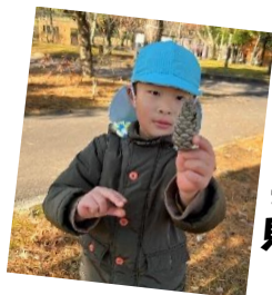
松ぼっくりも 見つけたよ！