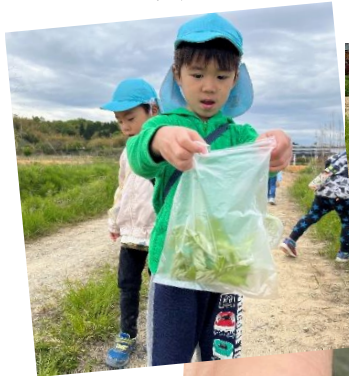
みんな～見つけたら ここに入れて！