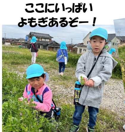
ここにいっぱい よもぎあるぞー！