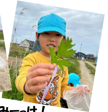
大きいのみーっけ！