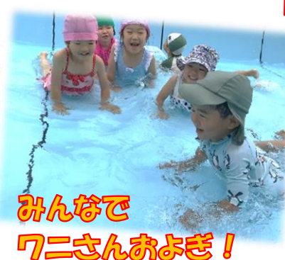
みんなで ワニさんおよぎ！