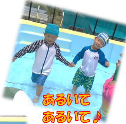
あるいて あるいて♪