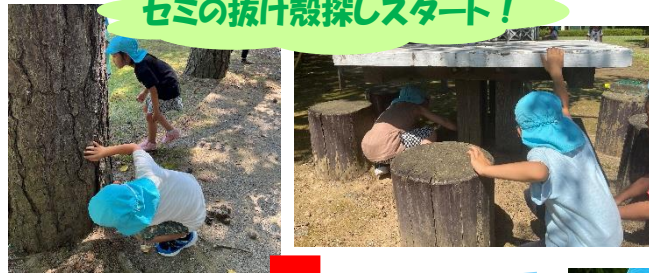
セミの抜け殻探しスタート！