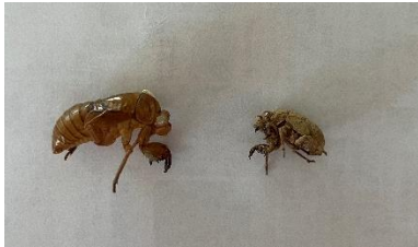
絵本に載ってたよ！ 色んなセミがいるんだね 左…アフラセミ 右…ニイニイセミ