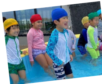
先生鬼に捕まった! 助けてー!

蓮代寺こども園で夏の遊びをするのも今日で最後! 大好きなプールに入りたい! とリクエストがあり、プール遊びで締めることになりました。プールの中では「鬼ごっこしよう!」と保育者や友だちを誘い、ワニ鬼ごっこで盛り上がりました。年長組になってから泳げるようになった子、水に顔をつけられるようになった子も多く、鬼に捕まってしまった友達の足の間をくぐって、積極的に助けていましたよ。「水、つめた〜い!」「めっちゃ楽しかった♡」と、最後のプール遊びを堪能したことも達でした。