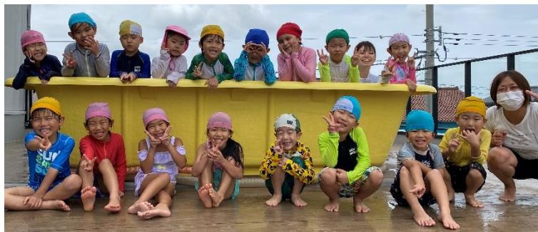
最後のプールの、楽しかったよ!