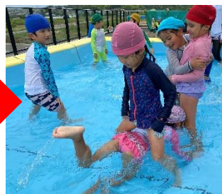
やったー! くぐれた〜!