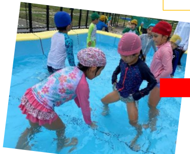
お友達のこと、助けるぞ!