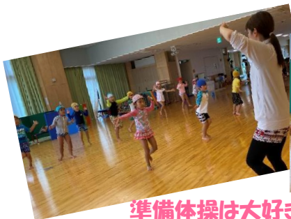
準備体操は大好きなよさこいを元気いっぱい踊りました♪