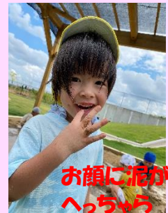
お顔に泥がついても へっちゃん