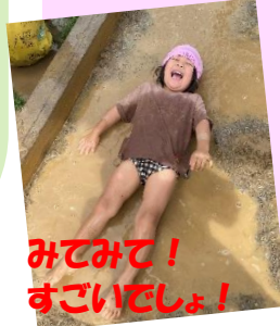
みてみて! すごいでしょ!