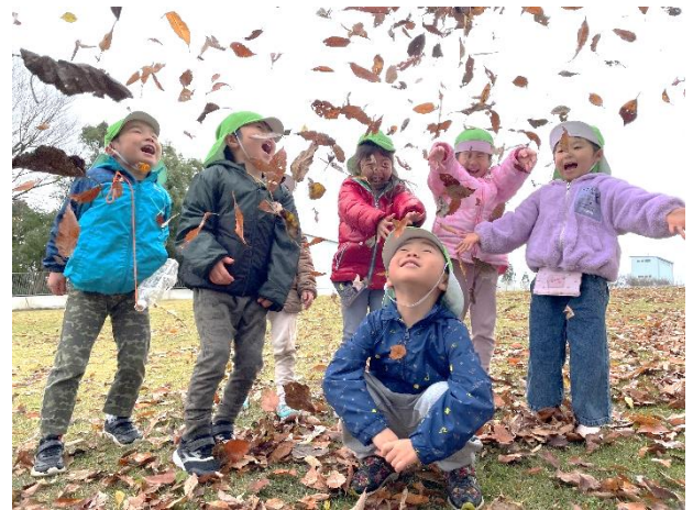
落ち葉のシャワー！きゃー！楽しい！