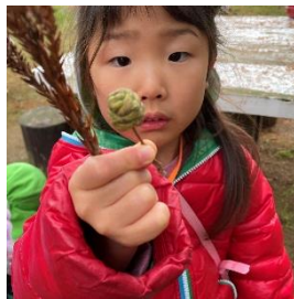
なんか形がハチミツの入れ物みたい！