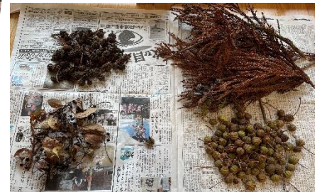
たくさん拾ったね！

たくさん木の実を見つけ、体も思い切り動かして遊びとっても楽しかったようです♪帰りのバスから白山が綺麗に見えて「お山にもう雪降るとる～♪」「あのお山で滑ったら楽しそうやね～」と盛り上がっていましたよ。また、帰ってきてから木の実を種類別に仕分けすると「可愛いクリスマスの飾り出来そうや～♡」「サンタさん見にきてくれるかな？」とクリスマスにも期待を膨らませていたゆい組さんでした♪