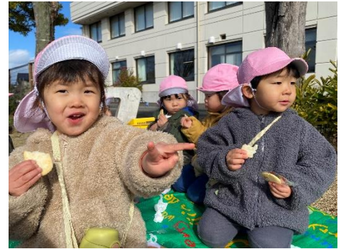
外でおやつを食べたよ！ おいし〜い！