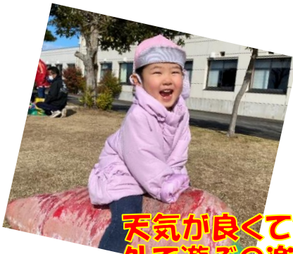
天気良くて気持ちいいね♪ 外で遊ぶの楽しいね！

また、北部児童センターの中にある『木のおうち』という部屋でも遊びました。様々な木製の玩具があり、「パズルしてみよっと！」「電車ある！」と好きな物を次々と棚から出して来て、楽しんでいましたよ。