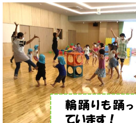
輪踊りも踊っています!