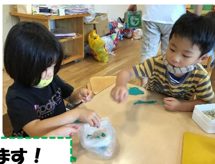
青のりを作っています!