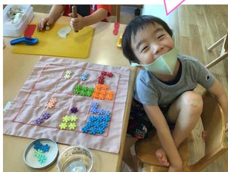
(ジュース屋さん) 何味がいいですか?