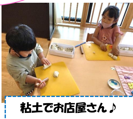
粘土でお店屋さん♪