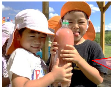
こんな色の ジュースが できたよ！