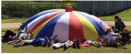
パラバルーンの様子

うんどうかいウィーク最終日！パラバルーンをしたり、たんぽぽ組やひまわり組の競技を応援したりしました。たんぽぽ組の満水リレーが終わると、「やってみたい！！」という声があったので、ゆい組も挑戦しました！色水がこぼれないようにそっと運んだり、ペットボトルの口に慎重に注いでいましたよ。