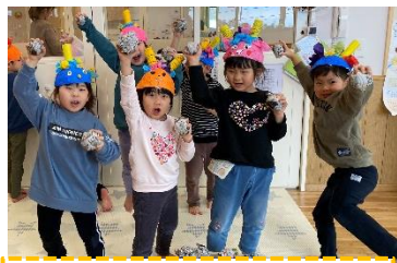
鬼をやっつけるぞ！