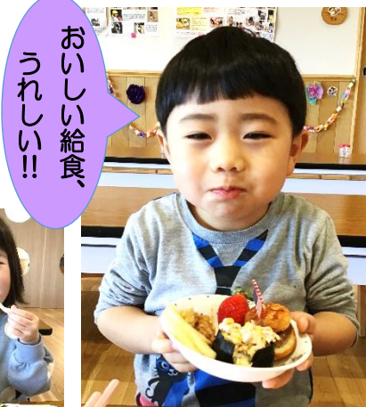
おいしい給食、うれしい!!