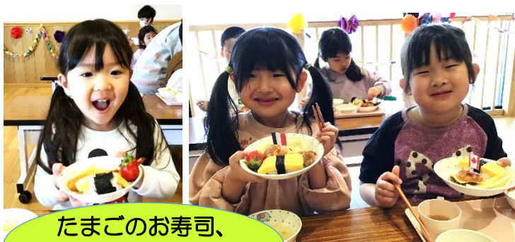
たまごのお寿司、おいしいよね!!