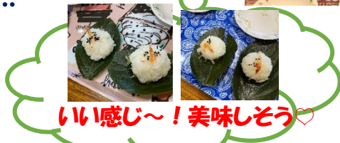
いい感じ～！美味しそう♡