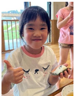
みんなで作ったお寿司、おいし～♡