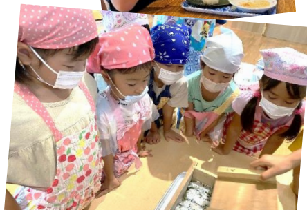
みんなのお寿司、ぎゅうぎゅうやあ～！