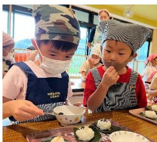
そ～っとゴマを乗せて…