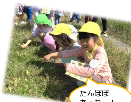
たんぼぼあったー！