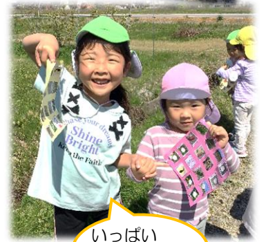
いっぱいみつけたよ！