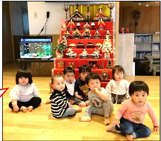
ひな人形の前で みんなでパシャ☆

今日はひな祭り♪子どもたちは絵の具を使って様々な方法で制作に取り組み、可愛らしいお内裏様とお雛様が完成しました。本日制作を持ち帰ります!