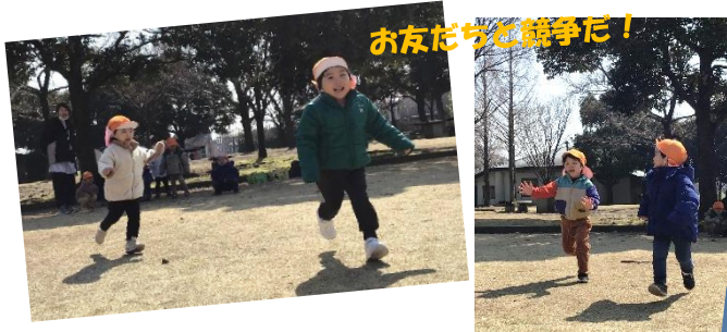
お友だちと競争だ!

今日はちゅうりっぷ組で最後のバス園外の日でした。「今日バス乗る〜?」ととても楽しみに登園してきた子どもたちです。バスの中では「イオン見えた!」「ガソリンスタンド!洗車しとる!」「車いっぱいある!」「もうつく〜?」とたくさんお話ししながら向かいましたよ。広い芝生でかけっこをしたり、ふわふわドームや滑り台で遊んだりしましたよ。「よーいどん」の合図で一斉懸命走ったり、ふわふわドームでたくさん跳ねたりしましたよ。