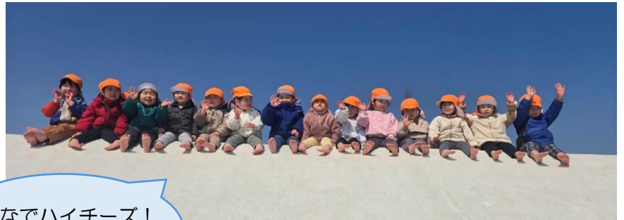
みんなでハイチーズ! 一緒に滑ったよ!