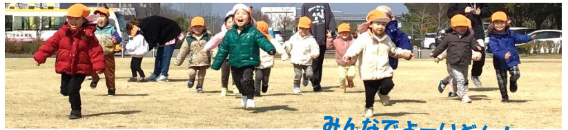
みんなでよーいどん!