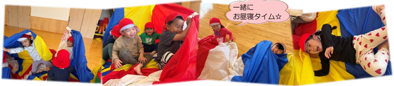
一緒に お昼寝タイム☆

バルーンをもってスキップをしたり、いないいないばあをしたり、膨らませて気球のような形を作ったりと様々な動きを楽しんでいます。特に子どもたちのお気に入りにはバルーンの中に入ってお家のような形を作ることです。最初はお家の天井が低いと「狭い～！」と言っていた子どもたちでしたが、みんなで動きを合わせると天井が高いお家を作ることができると気づき、回数を重ねるごとに「やったー！成功だよ！」と喜んでいますよ。