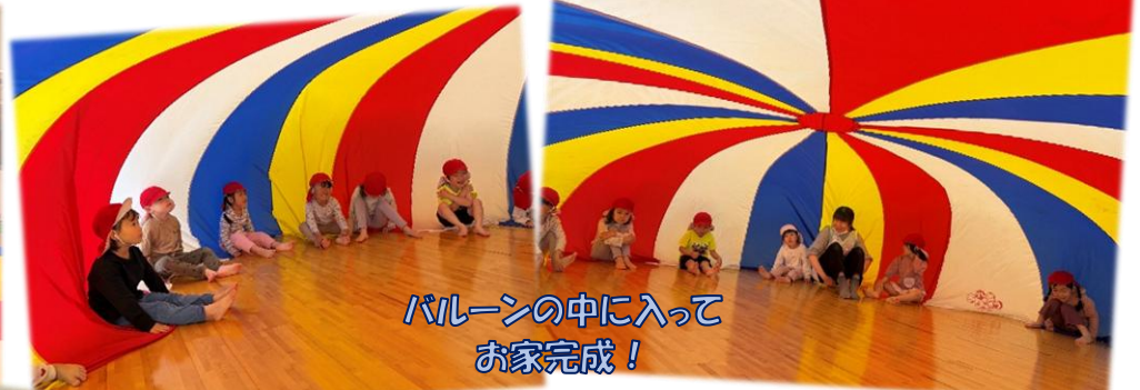
バルーンの中に入って お家完成！