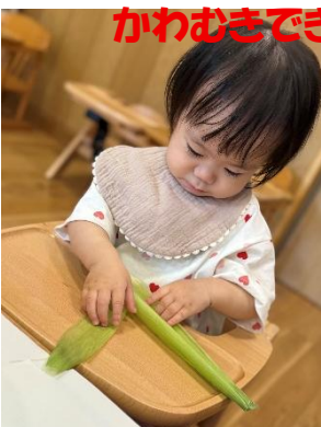
かわむきできるかな？！

とうもろこしの感触に触れたり、手先を使って皮をひっぱったりして、保育者と一緒に皮むきも楽しみました！ひげや皮にも興味津々で触れる姿が見られましたよ♪