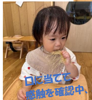
口に当てて 感触を確認中..