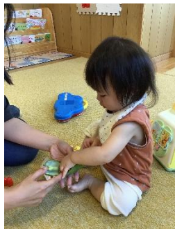
中を割ると、 お豆があったね。