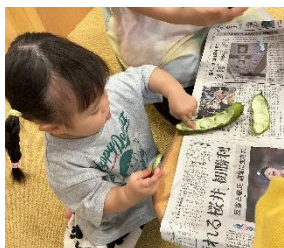
ふかふかのところが 気になる様子