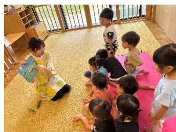
そらまめくんのベッドという 絵本のお話を聞いたら… ふかふかのベッドで寝たい！ とブランケットをベッドに敷 いてお昼寝しました。