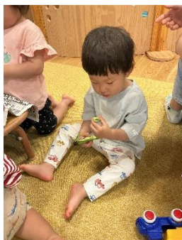
そら豆をじっくり観察中