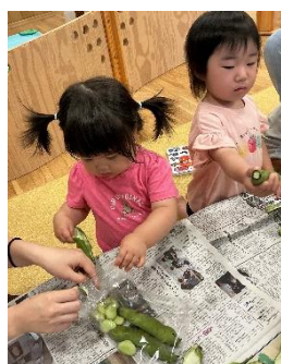
わたし、袋詰め担当。