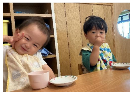
おいしく食べたよ♪