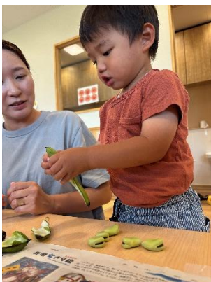
ティラノサウルスの卵！