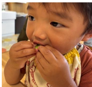
おいしーいー いっぱい食べたよ