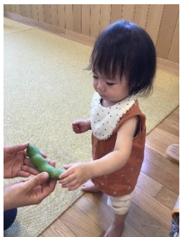
恐る恐る手を伸ばし そら豆に触れています。

未満児の子どもたちが、そら豆のさやむきに挑戦しました。ひよこ組、りす組の子どもたちは、大きなさやに恐る恐る触れたり、保育者と一緒にさやを割って、そら豆を一粒ずつ大切に取り出したりしてしていました。ちゅうりっぷ組の子どもたちは自分でボキッと豪快に折って、そら豆を取り出し、卵に見立てたり、触った感触を伝えたりしてしていました。朝のおやつ時間にみんなで食べましたが、自分たちでむいたそら豆は、いつも以上に興味を持って味わう姿が見られました。